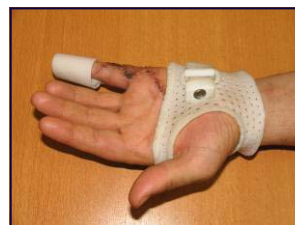
Exemple d'orthèse post-opératoire