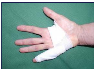
Exemple de pansement post-opératoire

Une rééducation des doigts vous sera le plus souvent prescrite (pour récupérer la flexion des doigts) vers le 10-15 ème jour.